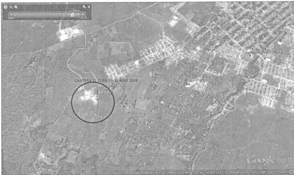
Cantera El Edén en el año 2009.

POR MEDIO DEL CUAL SE ORDENA UNA INDAGACIÓN PRELIMINAR